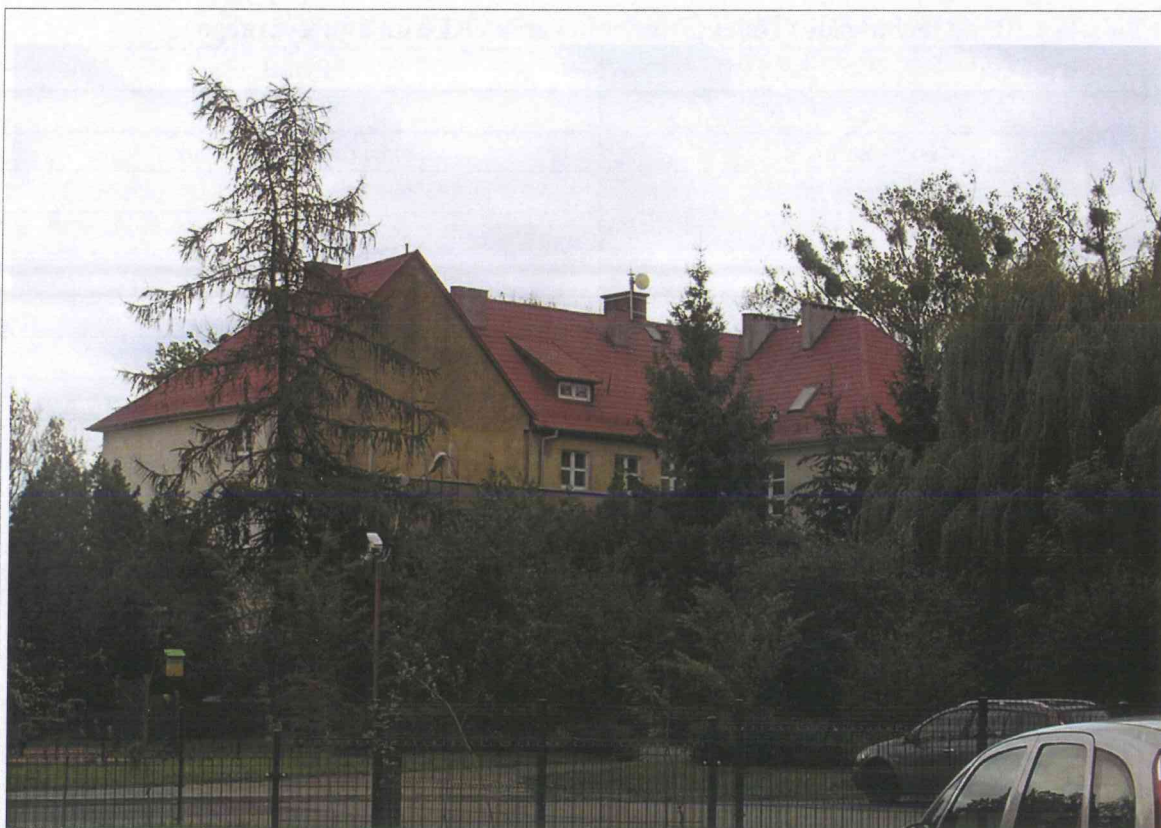
Fot. 1. OM Chełmce / Szkoła Podstawowa – widok budynku z anteną linii radiowej Emitel