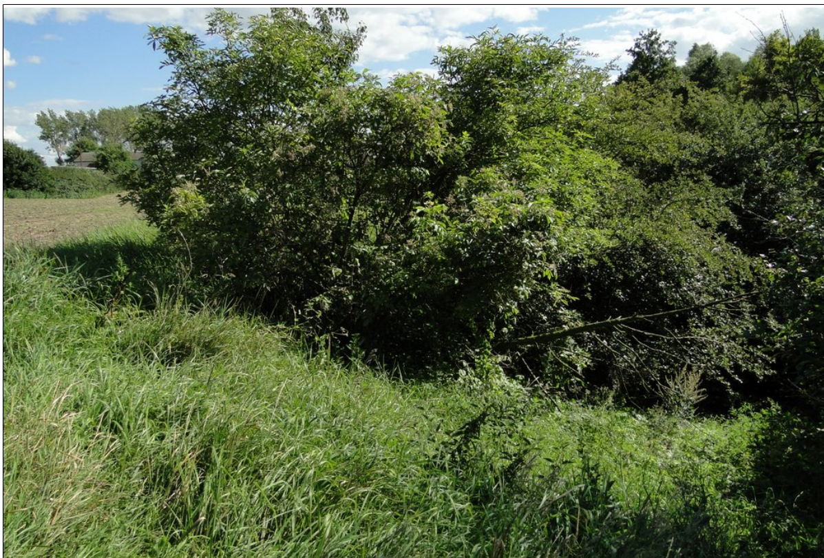
Skarpa główna osuwiska.