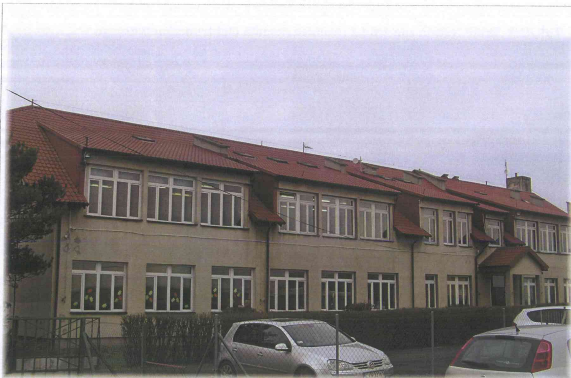
Fot. 1. OM Wola Wapowska 6 – widok budynku z anteną linii radiowej Emitel