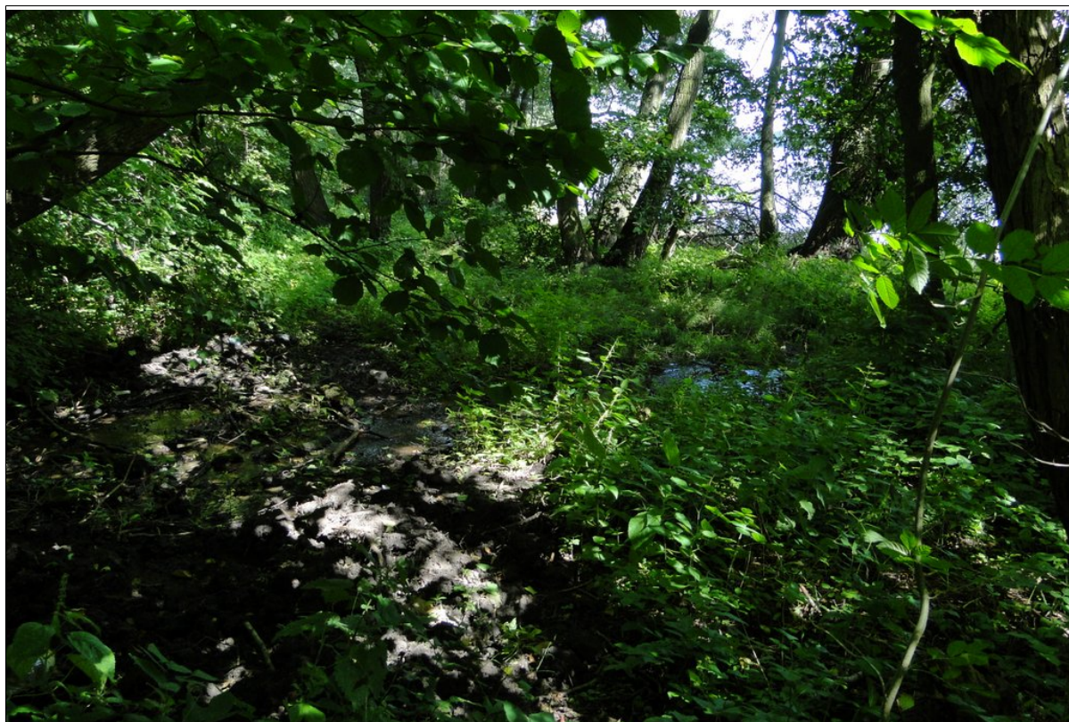
Podmokła powierzchnia osuwiska.