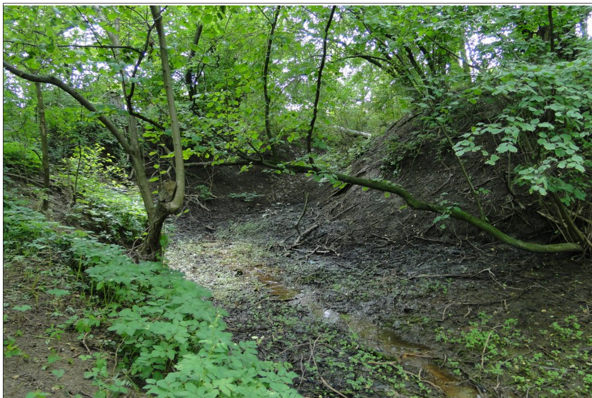
Skarpa główna osuwiska oraz podmokłości.