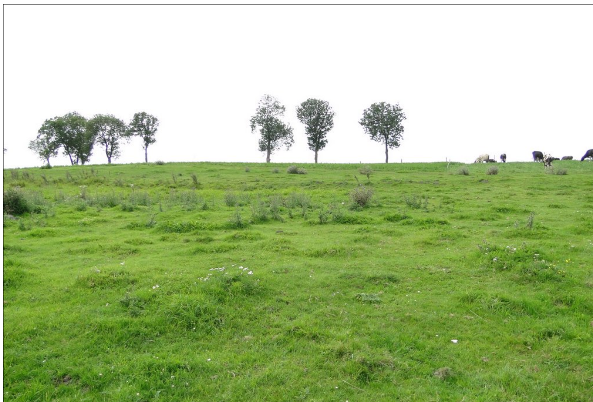
widok na osuwisko od strony Jeziora Pakoskiego.