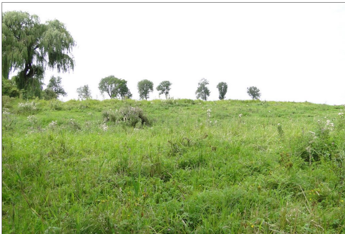
Skarpa wtórna osuwiska (pierwszy plan) oraz skarpa główna (w tle).