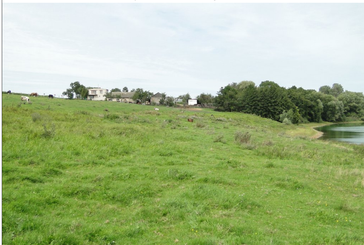
Widok na osuwisko od strony południowej.