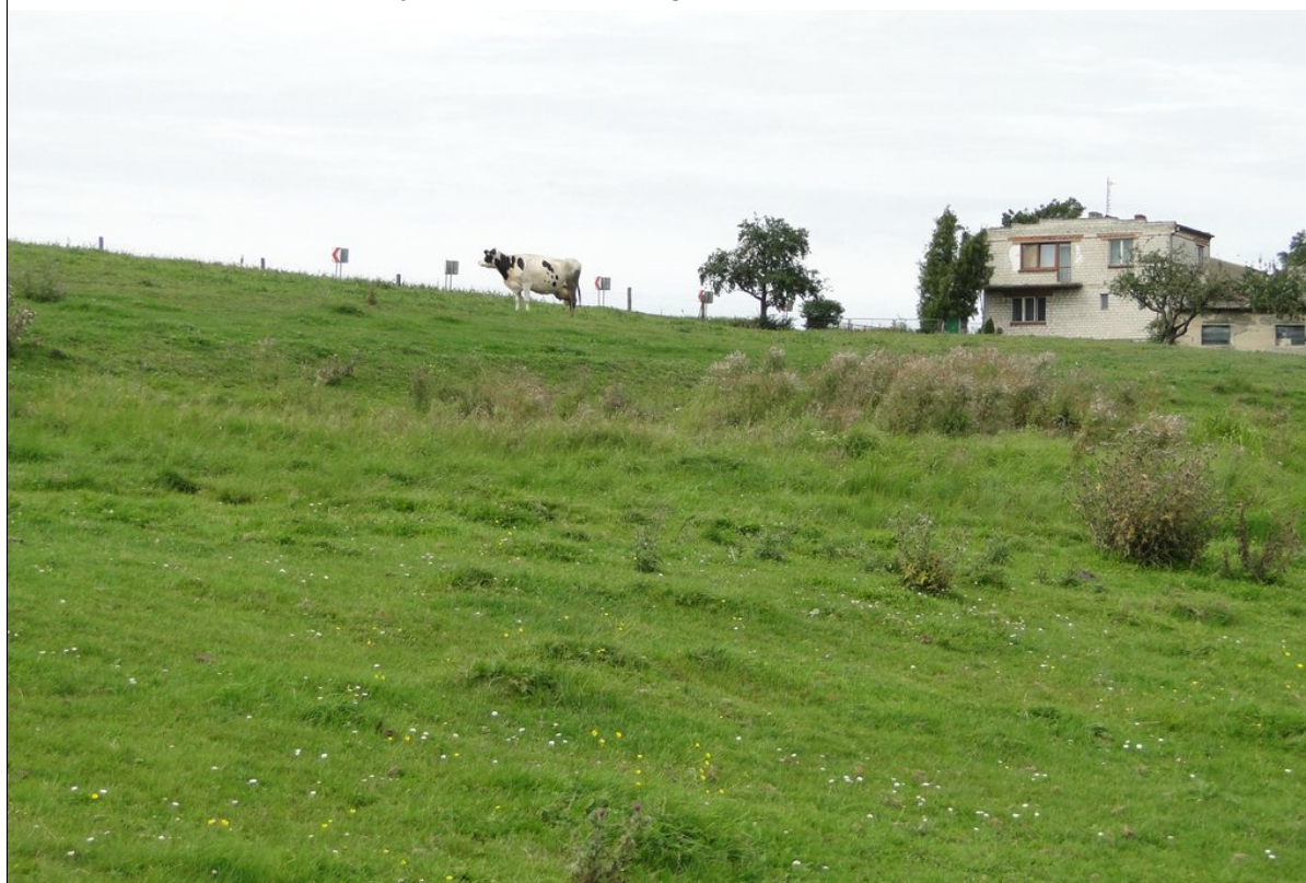
Część środkowa osuwiska.