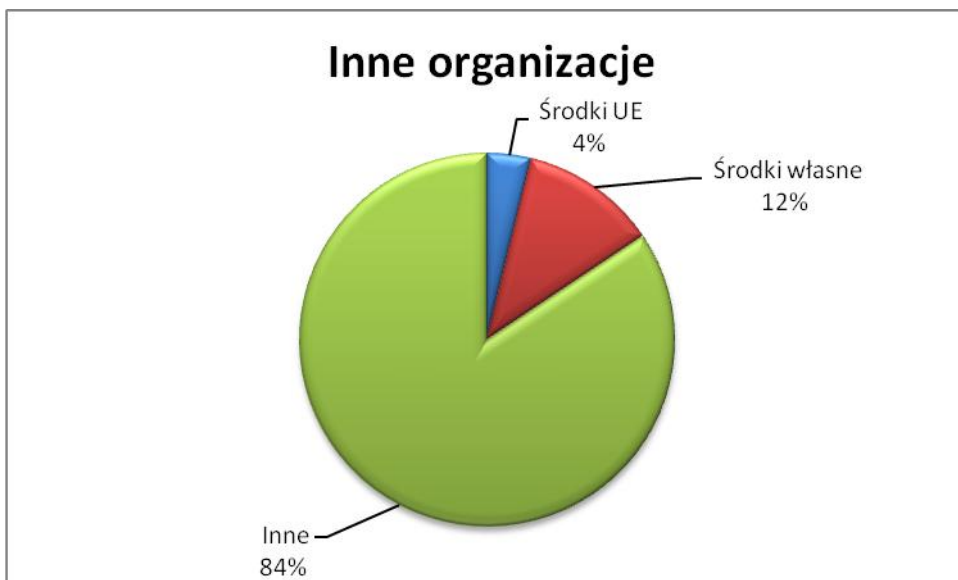
Diagram 1. Wykonanie planu finansowego zadań wskazanych w załączniku nr 11 w ujęciu procentowym