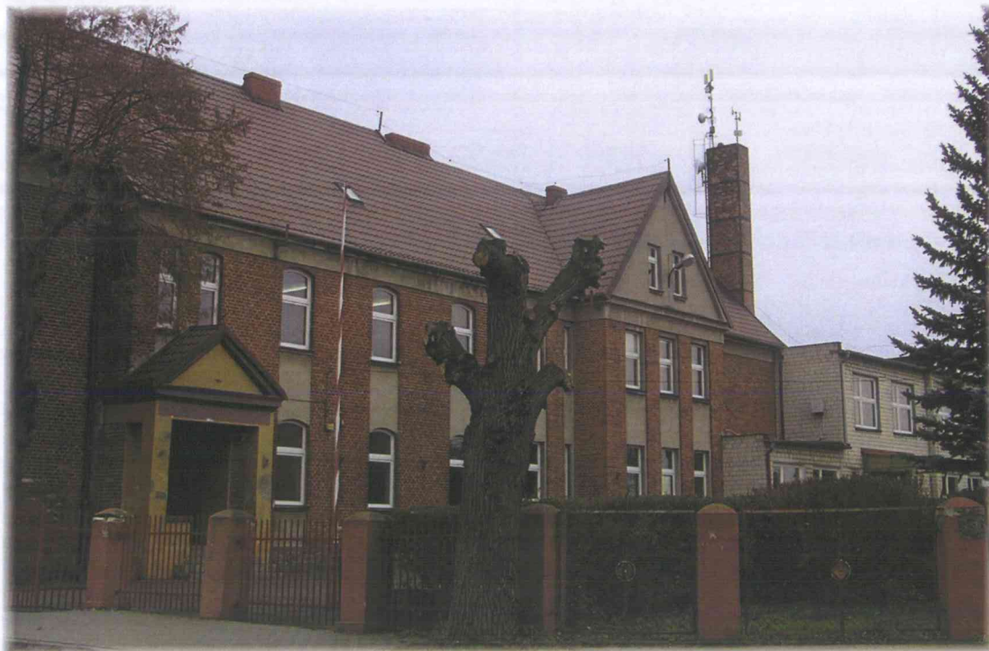
Fot. 1. OM Bachorce 42 – widok budynku z anteną linii radiowej Emitel (na kominie)