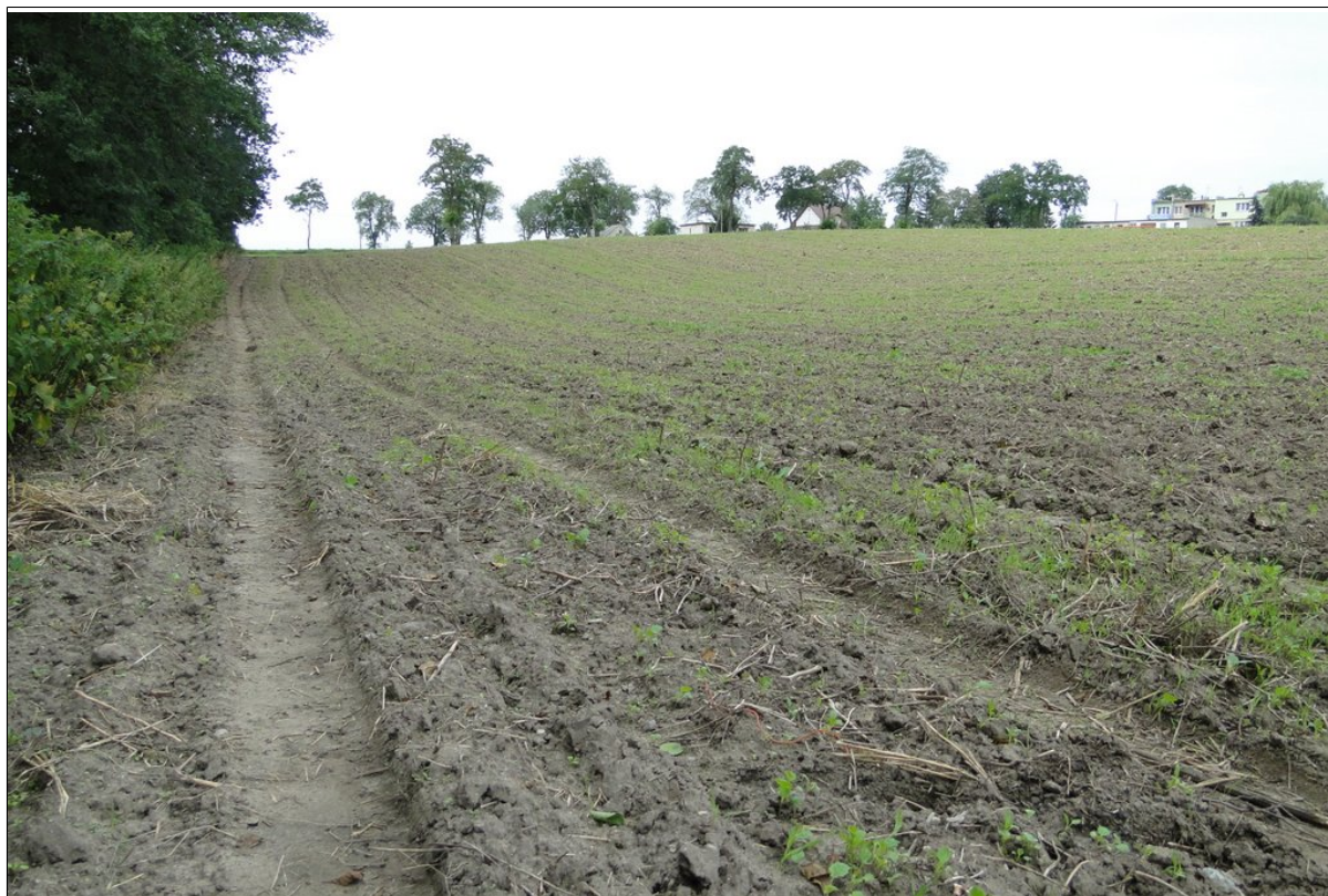
Część górna osuwiska wraz z przekształconą rolniczo skarpą główną